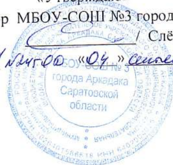
График контроля За состоянием охраны труда в МБОУ-СОШ № 3 на 2023-2024 учебный год